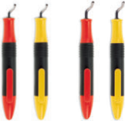
Globurr B עם סכין B10

קלט B (סטנדרטי) או קלט E (HD) לארבעה יישומים שונים