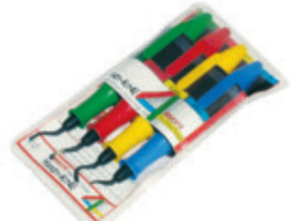
Handy Kit הקלט השימושי