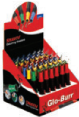
Rainbow Kit הסדרה הצבעונית זמין עם סכיני B או E