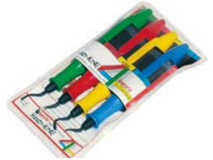
핸드 키트 4B 또는 4E 블레이드 세트구분 4B 키트 = 154-90042 4E 키트 = 154-29144