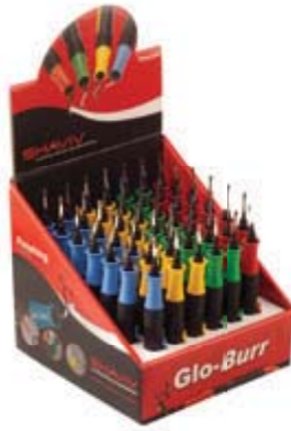
레이보우 키트 B 또는 E 블레이드 사용 글로버 B = 154-29136 글로버 E = 154-00013