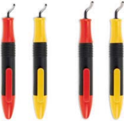
글로버 B B10 블레이드 사용 빨강 = 155-29153 노랑 = 155-29154

소지하기 편리하고, 일상 작업에 보편적으로 사용할 수 있는 소형 디버링 툴 글로버