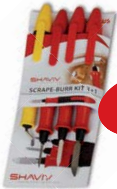
3 + 1 스크레이퍼 세트 글로버 B 무상제공